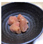
自家製辛子明太子

有機農業に取り組んでおられる農家の方の悩みは、規格外（間引いたものや虫が喰ったものなど）の野菜の扱いだそうです。ティア様は、このような野菜を積極的に受け入れ、生産者の方々とその土地の埋もれた食材に光を当てることを最大の目的とされています。また、もうひとつのコンセプトが「3世代で食べられる。そして毎日繰り返して食べても飽きのこない食事」です。赤ちゃんからお年寄りまで、それぞれが好きな料理を好きなだけ食べられるようになっていきます。