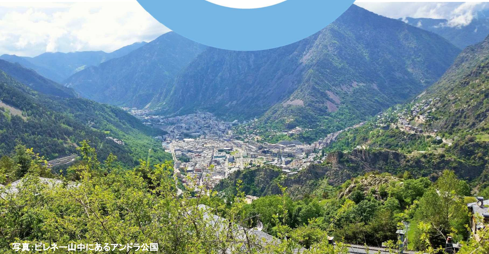
写真:ピレネー山中にあるアンドラ公国