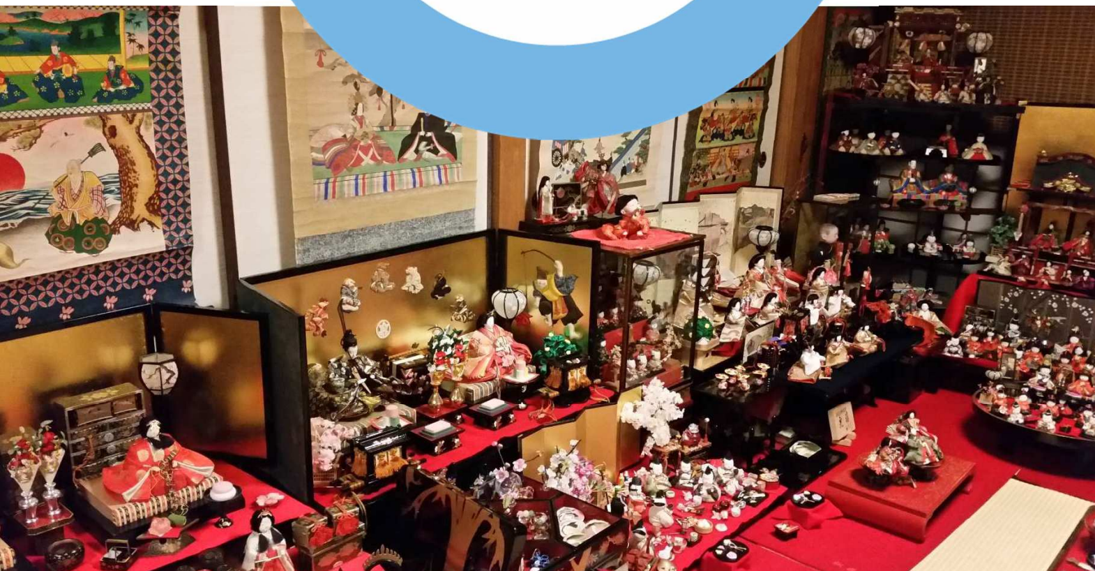
※我が家のひな飾りです。今年も700~800体のひな人形で賑わっております。