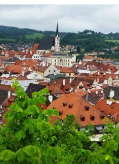
チェスキークルムロフの街 (チェコ)

いつになく豪華で平穏無事な旅を楽しむことができました。（*^。^*） 皆様のご健勝と事業の益々のご繁栄を祈念申し上げます。