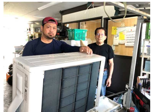
左から2代目の瀬上玄佐男社長と前社長

新しい店舗では、人とのつながりを大切にされる社長の思いから憩いの場も設けられるとのこと。 店舗完成時にはぜひ皆様もお立ち寄りください。