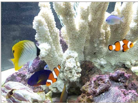
「かわいい家族です♪」