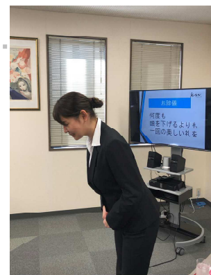
10月に開催したビジネスマナー一日集中研修

秋が深まるこの季節、税理士法人絆のセミナーをご活用していただき、新たな挑戦や変化につなげていただければ幸いです。