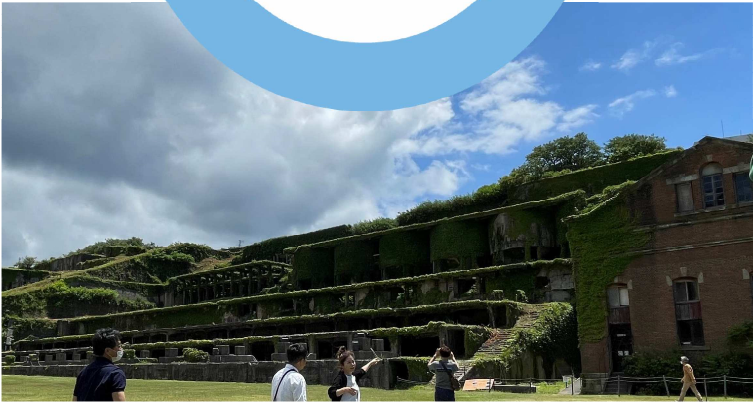
令和4年6月 新潟県 佐渡島 北沢浮遊選鉱場跡